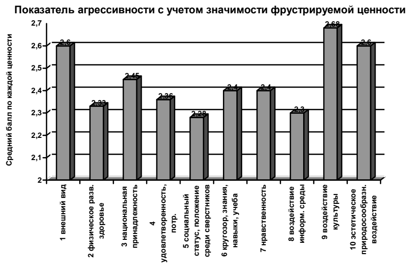
Рис. 2. Показатель агрессивности младших школьников со средним уровнем неприятия чужого с учетом значимости фрустрируемых ценностей.