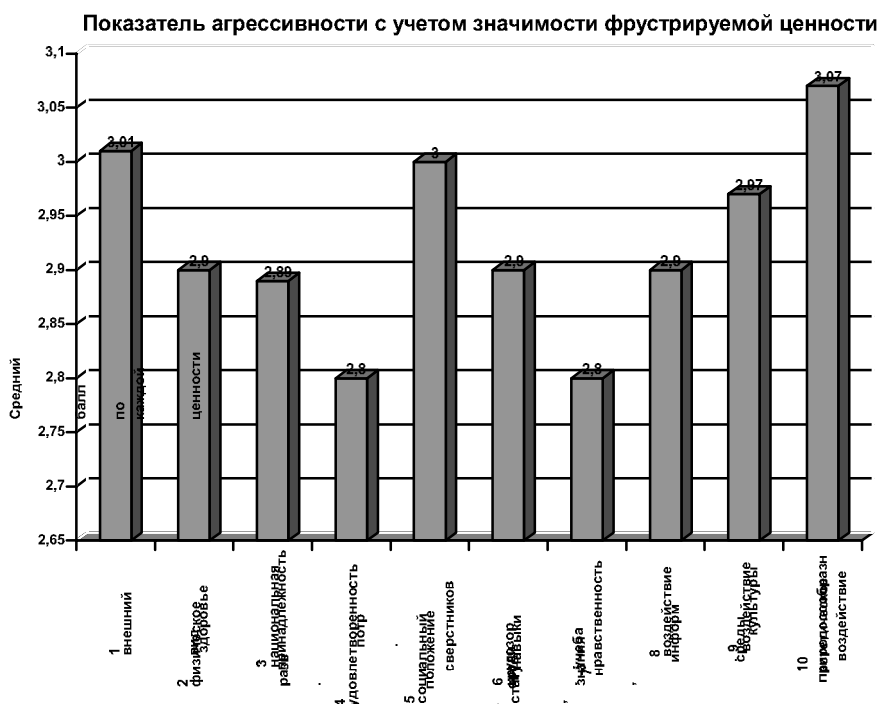
Рис. 1. Показатель агрессивности младших школьников с низким уровнем непринятия чужого с учетом значимости фрустрируемых ценностей.

Однако у детей с разным уровнем принятия-непринятия чужого эти связи имели существенные особенности. Для детей с низким уровнем непринятия чужого наиболее значимой была фрустрация эстетико-природных ценностей (рис.1), для детей со средним уровнем – культурных ценностей (рис.2), для детей с высоким уровнем – ценностей в здоровье и физическом развитии (рис.3).