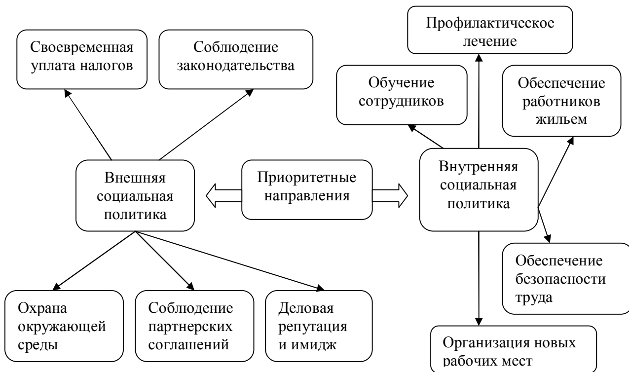
Рисунок 1. Приоритетные направления деятельности бизнеса в области социальной ответственности 3

Политика формирования социально ответственного поведения условно представлена в виде следующей схемы (рисунок 1).