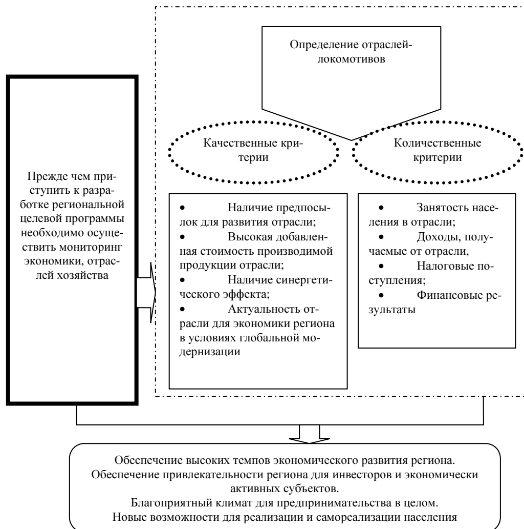
Рисунок 2. Механизм выбора приоритетных отраслей в рамках регионального развития 2

При выборе отраслей, локомотивов региональной экономики, должны быть разработаны количественные и качественные критерии выбора. Они в своей совокупности должны быть нацелены на достижение поставленных целей, среди которых, помимо общеизвестных и приоритетных, немаловажную роль должны играть создание новых возможностей для реализации и самореализации населения. И здесь в целях наиболее эффективного достижения поставленных задач необходимо как раз привлечение муниципальных органов власти к разработке и последующей реализации программ развития приоритетных отраслей.