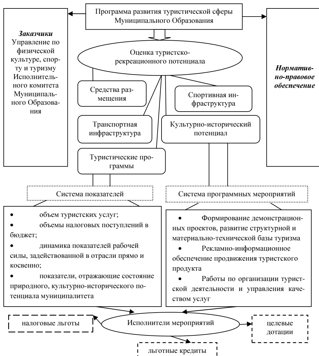
Рисунок 3. Механизм построения программы развития туризма на уровне МО 3

пальных программ развития туризма и обеспечения их методологического единства Федеральное Агентство по туризму организовало исполнение приказа “Об утверждении типовой структуры региональной муниципальной программы развития туризма РФ” от 11 июля 2008 года, рекомендовало субъектам РФ руководствоваться данной типовой структурой при разработке муниципальных программ развития туризма[4].