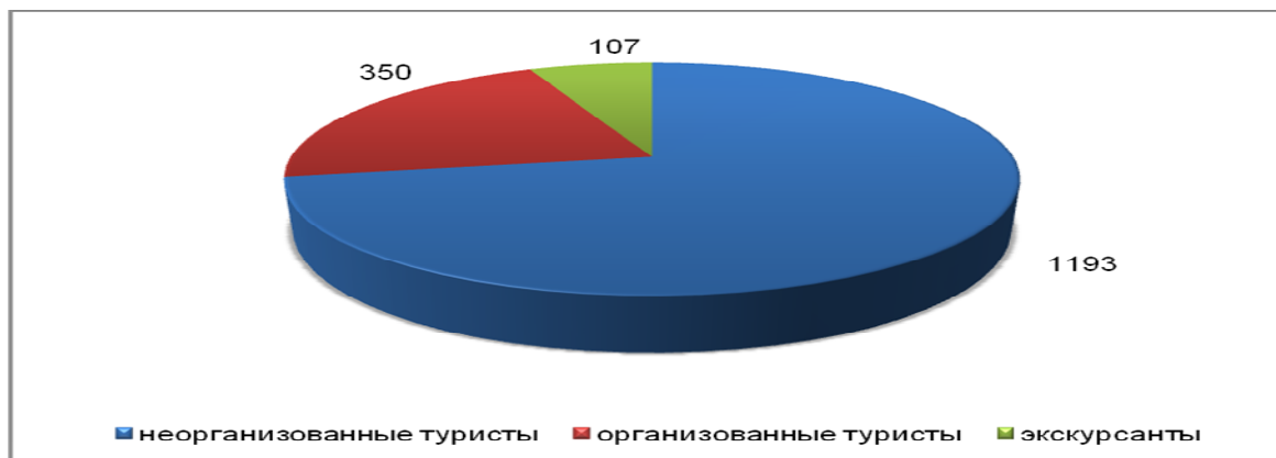
Рис. 3. Туристский поток в Республике Карелия в 2009 г.

В Республике Карелия за последние несколько лет произошло как количественное, так и качественное изменение предложения услуг по размещению туристов (рис. 4).