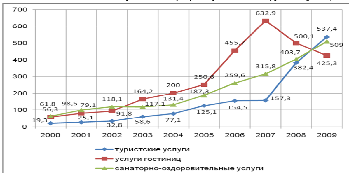
Рис. 4. Развитие туристской инфраструктуры и доходы от сферы туризма.

В Республике Карелия за последние несколько лет произошло как количественное, так и качественное изменение предложения услуг по размещению туристов (рис. 4).