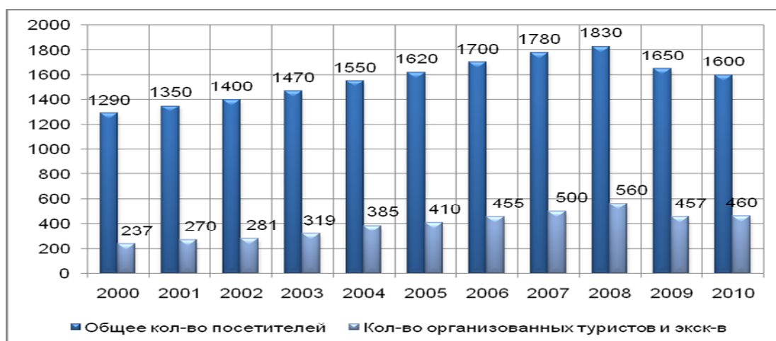
Рис. 1. Общее количество посетителей и организованных туристов в Республике Карелия, тыс. человек.

В настоящее время общий поток туристов в регионе оценивается экспертными методами. В данном случае речь идет обо всех посетивших республику, в том числе и неорганизованных туристах, приезжающих в гостевых целях. Согласно этой оценке, общее количество посетителей Карелии за последнее десятилетие возросло почти на четверть (рис. 1). В тоже время в кризисный период наблюдался спад (количество посетителей в 2009 г. сократилось на 10% по сравнению с 2008 г.).