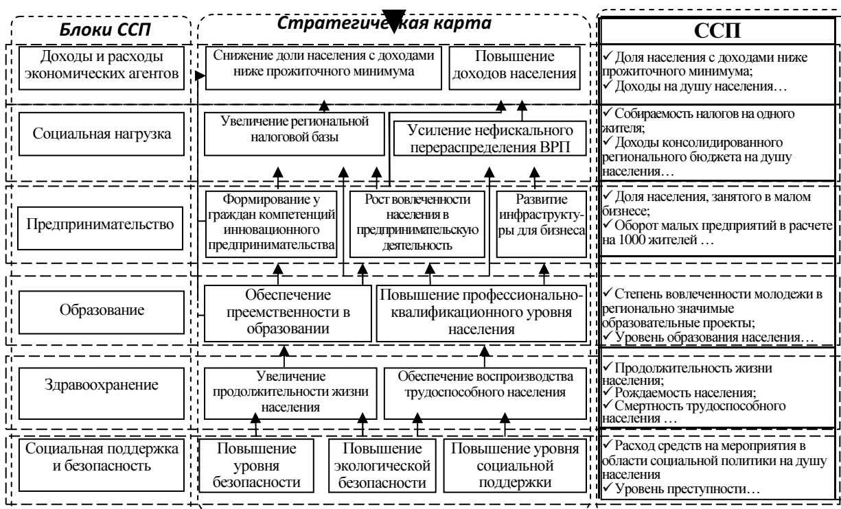
Рис. 2. Причинно-следственные связи между целями развития социально ориентированной экономики региона, зафиксированными в ССП.

В-третьих, обработка результатов анкетирования и отбор показателей для включения в модель ССП с использованием исследовательских методов проверки полученной информации на валидность и корректность.