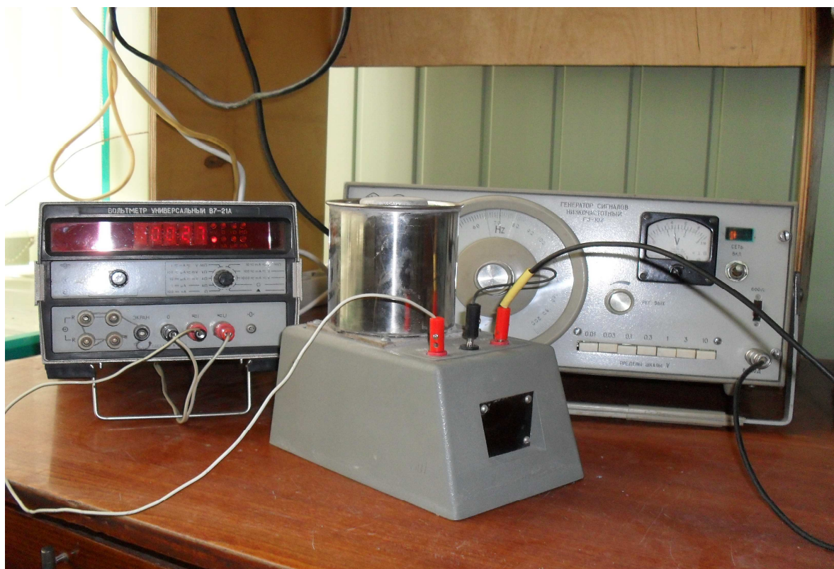
Рис. 1. Измерительная ячейка с цилиндрическими электродами, подключённая к генератору и мультиметру

Для проверки высказанного предположения была использована специальная измерительная ячейка с цилиндрическими коаксиальными электродами, изображённая на рис.1.