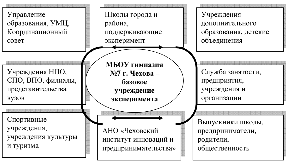
Рис.2. Система социального партнерства МОУ гимназии №7 г. Чехова