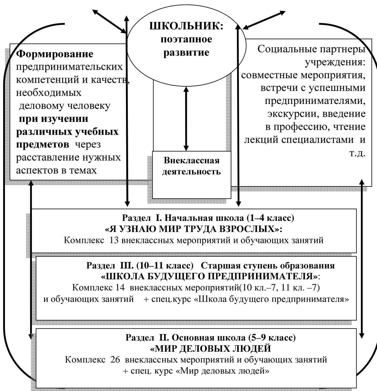
Рис. 3. Педагогический комплекс, формирующий и развивающий предпринимательские компетенции и деловые качества у школьников через урочную и внеурочную деятельность

В схеме представлены основные субъекты образовательного процесса, возможные социальные партнеры, система их действий и предпринимательские компетенции, которые можно развить в результате их совместной деятельности.