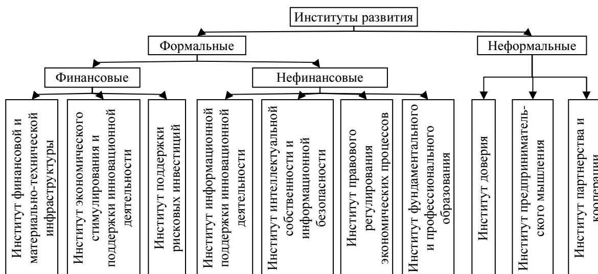
Рис. 1. Классификация основных институтов развития.

Определяющая роль неформальных институтов развития признается и на уровне государственного управления экономикой. В статье Д. Медведева «Россия – вперед!» подчеркивается важность традиций и настроений в обществе как фактора формирования экономических процессов [7]. Однако нельзя не отметить, что практические шаги по формированию и совершенствованию неформальных институтов развития предпринимаются крайне дискретно и непоследовательно. В свете вышесказанного представляется логичным уточнение классификации современных институтов развития и выделение в их составе неформальных институтов (рис. 1).