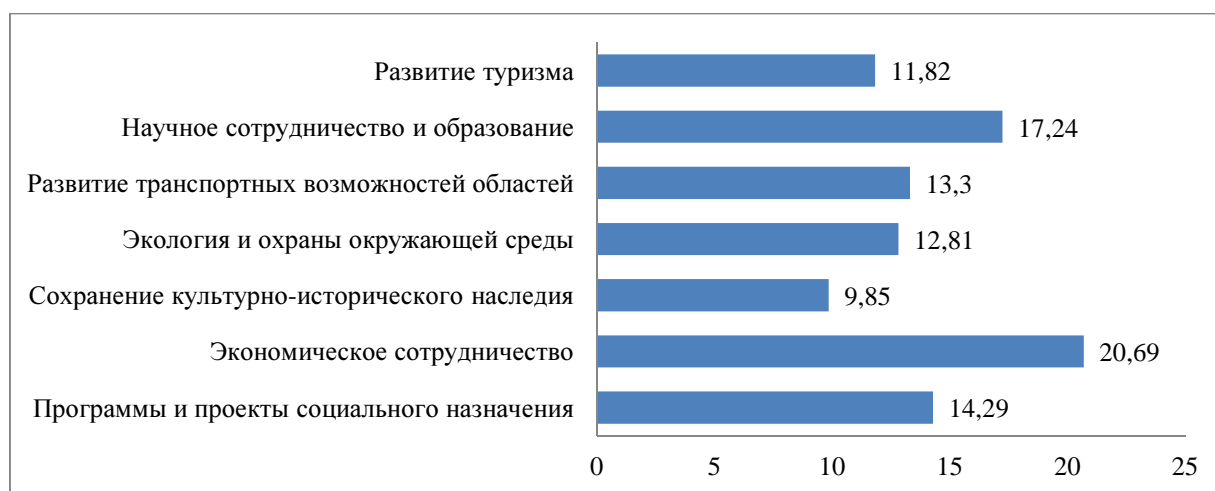
Рисунок 1. Приоритетные направления сотрудничества (данные %)

Основной акцент эксперты делают на экономическом сотрудничестве – 20,69 % (рис. 1). Но показательно, что вторым приоритетом (17,24 %) было выбрано сотрудничество в сфере науки и образования, относящееся к взаимодействию в социогуманитарной сфере. Направления «Программы и проекты социального назначения» (14,29 %), «Развитие транспортных возможностей областей» (13,13 %) и «Экология и охрана окружающей среды» – 12,50 % были выбраны экспертами третьим приоритетом.