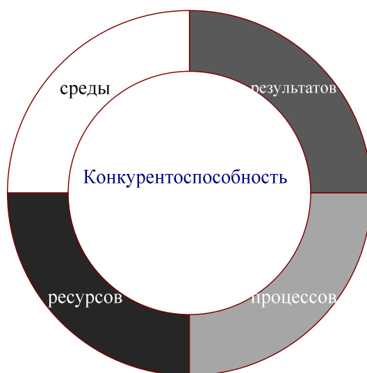
Рис.1. Составляющие конкурентоспособности вуза

Исходя из основных положений системной теории и неосистемного подхода, обосновывающего существование четырех базовых типов социально-экономических систем, при определении конкурентоспособности вуза мы предлагаем учитывать четыре основных аспекта: конкурентоспособность результатов функционирования вуза, конкурентоспособность ресурсов, конкурентоспособность среды вуза и конкурентоспособность процессов, происходящих в вузе (рис. 1).