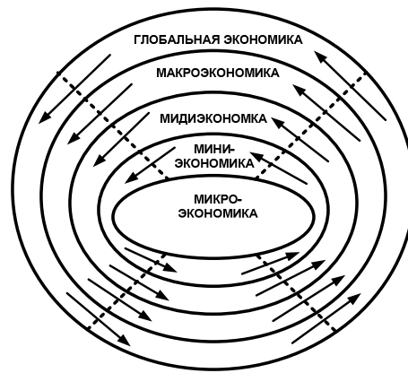
Рис. 2. Капиталоцентрическая модель организации во внешней среде

Рис. 2 отображает четырехсекторную модель (пунктирными линиями обозначены границы секторов экономики). В каждом секторе есть свои соисполнители, партнеры и потребители. В рамках многопродуктовой модели возможно движение капитала как в радиальном направлении (внутрь и наружу), так и между секторами. Заполняя регулярно эту диаграмму, можно заранее заметить неблагоприятные тенденции и информационную агрессию. Хронологическая последовательность капиталоцентрических моделей позволяет выявлять и анализировать существенные изменения окружающей среды организации в результате информационных воздействий [4].