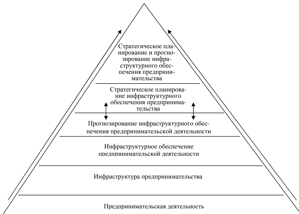
Рисунок 3. Генезис процесса стратегического планирования и прогнозирования инфраструктурного обеспечения предпринимательства

носит информационный характер, осуществляется на более длительный срок, чем планирование, и способствует повышению уровня качества стратегического планирования [5].