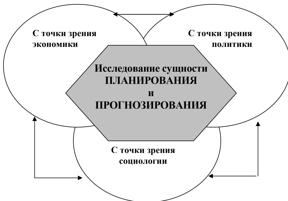
Рисунок 1. Концептуальный подход к исследованию сущности планирования и прогнозирования

Процессы прогнозирования и планирования очень тесно взаимосвязаны и взаимозависимы. Автор считает, что применение одного процесса с отрывом от другого снижает качество результатов обоих процессов. Сущностно-содержательную природу процессов прогнозирования и планирования автор предлагает рассматривать с трех точек зрения: политики, социологии и экономики (рисунок 1).