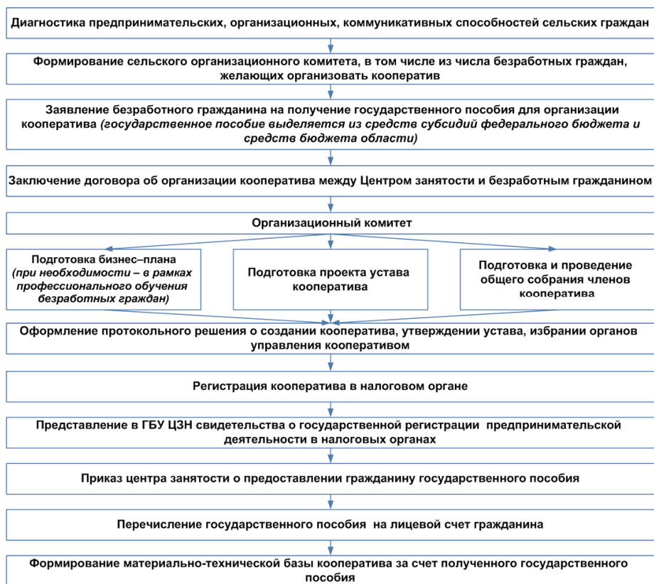
Рисунок 2. Алгоритм организации безработными гражданами сельскохозяйственного потребительского кооператива

Практика функционирования сельскохозяйственных потребительских кооперативов показывает, что высока потребность в информационном обеспечении их деятельности, в проведении образовательной и консультационной работы, в доступных финансовых и материально-технических ресурсах. В рамках антикризисной политики на территории Пензенской области создан ряд инфраструктурных организаций, призванных решать различные проблемы кооперативов, как на этапе их создания, так и в процессе функционирования. Наиболее значимыми из них являются: сельскохозяйственный кредитный потребительский кооператив второго уровня «Прогресс», Центр развития сельскохозяйственной кооперации, гарантийный залоговый фонд «Поручитель», ревизионный союз «СураАгроконтроль», Агентства по развитию предпринимательства. Однако их деятельность не имеет упорядоченного характера, отсутствует четкое понимание, концепция эффективного механизма поддержки сельскохозяйственной обслуживающей кооперации.