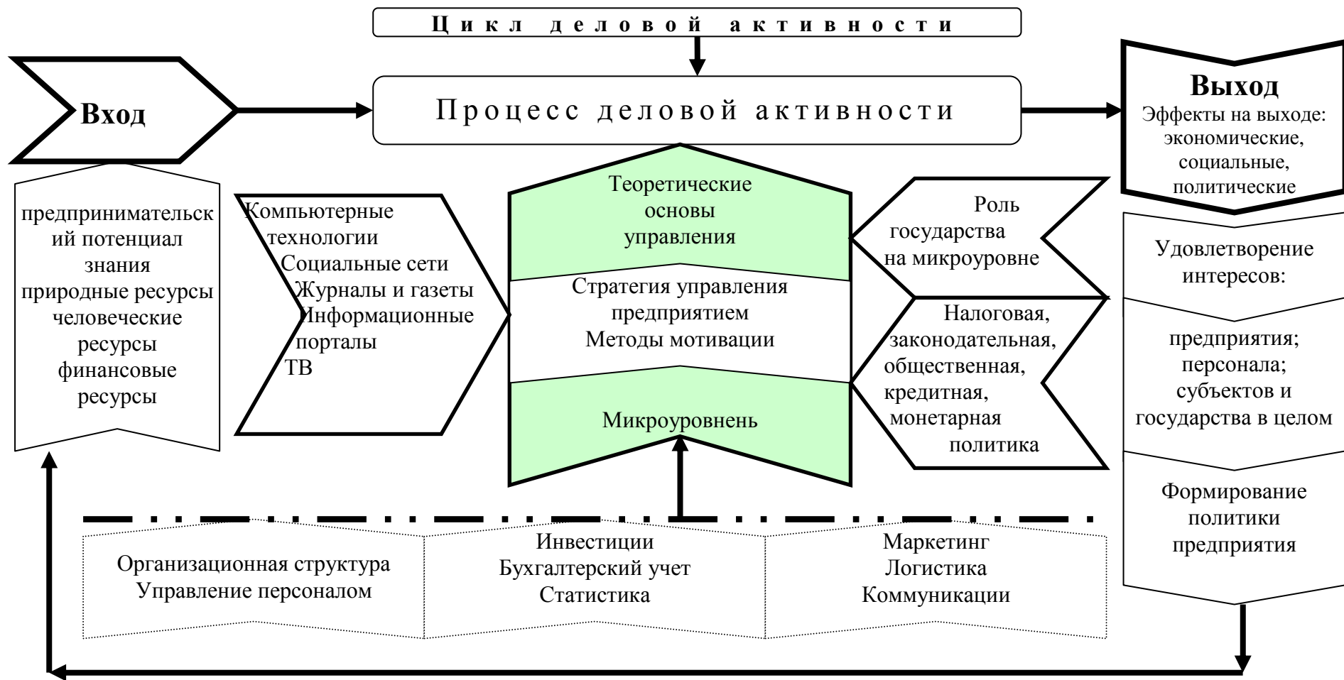
Рисунок 1. Система факторов процесса формирования деловой активности