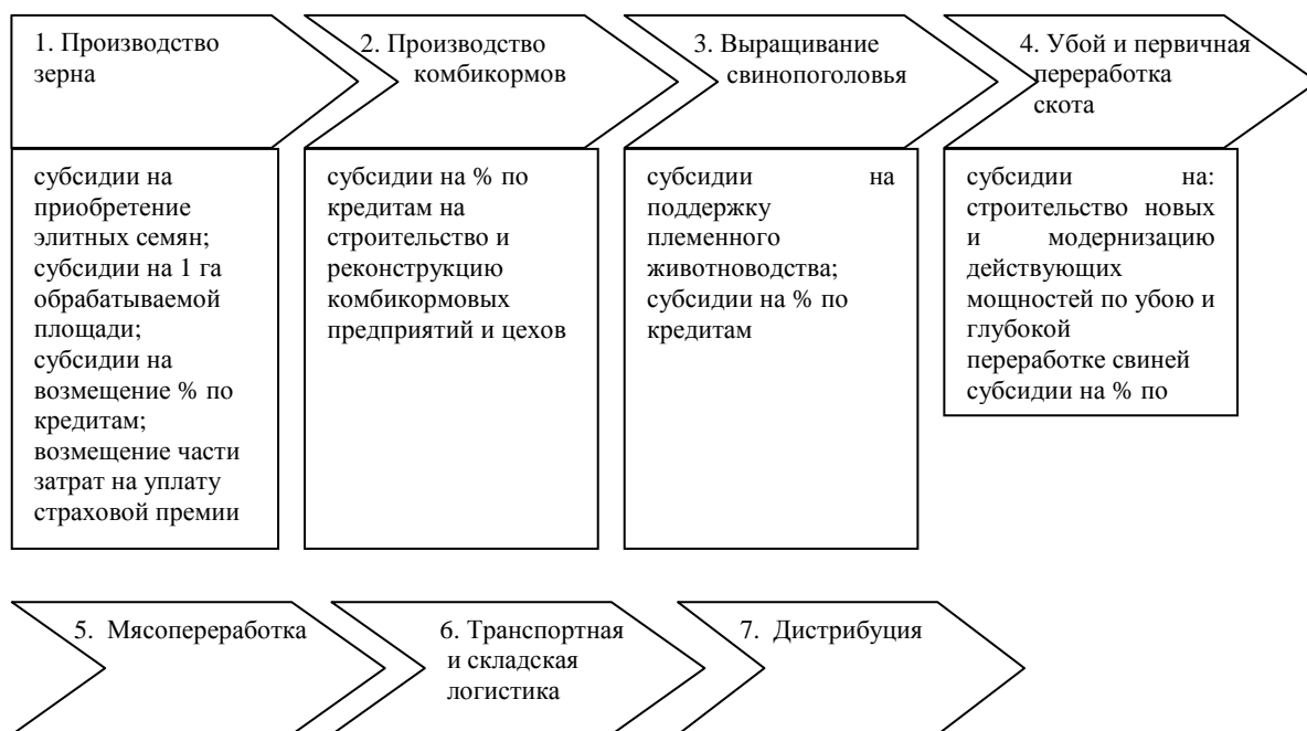
Рисунок 4. Цепочка создания стоимости ГК «Галина»

Основным направлением поддержки из федерального бюджета является субсидирование процентных ставок по инвестиционным кредитам. Кроме того из федерального бюджета предоставляются субсидии на приобретение элитных семян; субсидии на 1 га обрабатываемой площади; субсидии на поддержку племенного животноводства [1], возмещение части затрат на уплату страховой премии.