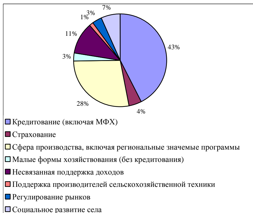
Рисунок 2. Структура федеральных субсидий в 2013 году

Наибольший удельный вес в структуре субсидирования, как и в предыдущей Государственной Программе на 2008–2012 годы, направляется на субсидирование процентной ставки по кредитам коммерческих банков (более 40 %), поддерживая в первую очередь финансовый сектор экономики а не товаропроизводителей.