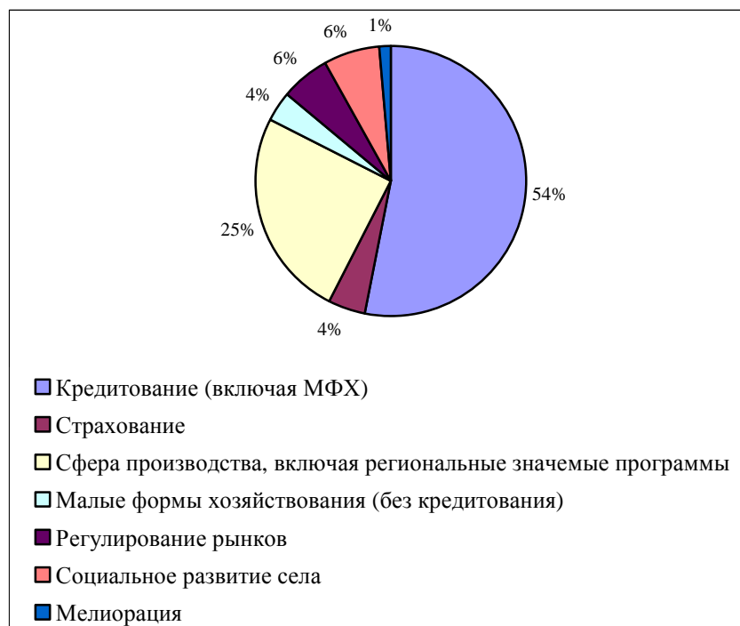
Рисунок 1. Структура федеральных субсидий в 2012 году