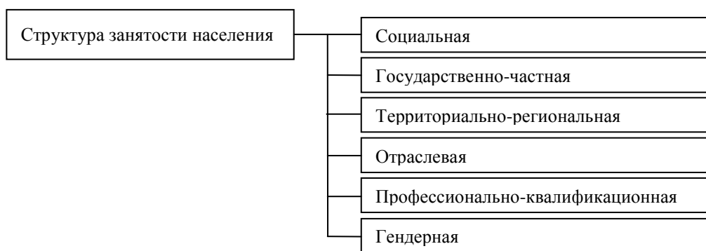
Рисунок 1 – Основные звенья структуры занятости

Социальная структура занятости населения характеризует изменения структуры общества, связанные с переориентацией классового устройства общества. В период проведения социально-экономических реформ структура социума как в России в целом, так и в отдельных ее регионах усложнилась в связи с ростом дифференциации доходов населения и углублением межрегионального социального неравенства. Исследование таких изменений имеет принципиальное значение для правильного понимания сущности и характера социальных процессов, происходящих в обществе, и принятия грамотных управленческих решений с целью их регулирования. Необходимость изучения изменения социальной структуры занятости обусловлена еще и тем, что проводимые реформы сопровождаются рядом проблем, которые имеют прямое отношение к снижению уровня жизни населения, который в свою очередь является показателем их неблагоприятного влияния на рынок труда и социально-экономическое развитие, особенно отдельных регионов России.