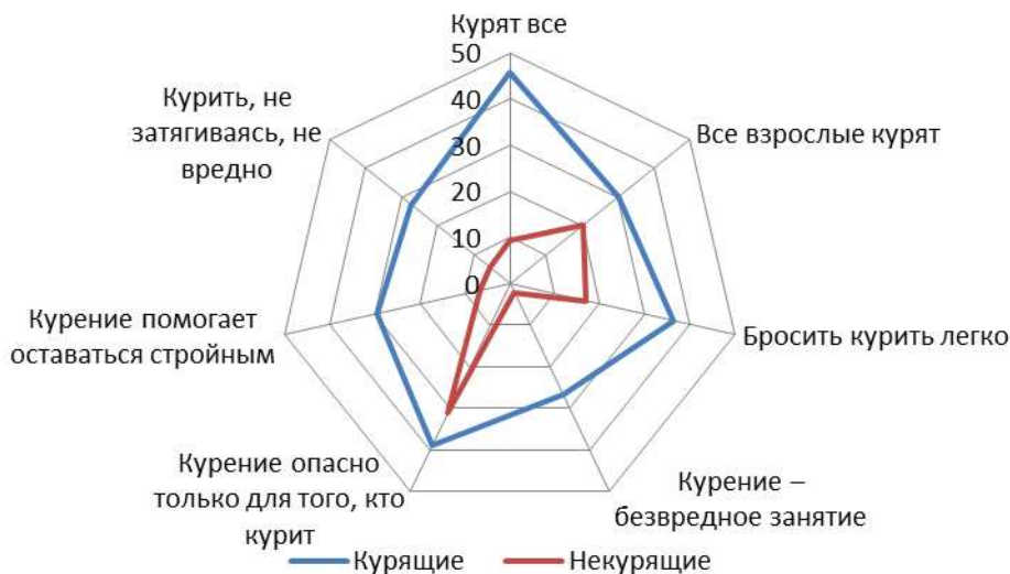
Рис. 1. Распространенность среди опрошенных мифов о курении

Для определения когнитивно-ценностного компонента установки против табакокурения и употребления алкоголя респондентам был предложен перечень утверждений, представляющих собой мифы о вредных привычках. Как видно из рисунка 1, самым распространенным мифом среди курящих школьников является ложное представление о том, что курят все (45,7%). Около 40% курящих убеждены, что бросить курить легко, и курение опасно только для того, кто курит. Каждый третий курящий респондент считает, что «все взрослые курят» (30,2%); «курение – безвредное занятие» (26,7%), «курение помогает оставаться стройным» (29,5%) и «курить, не затягиваясь, не вредно» (27,3%).