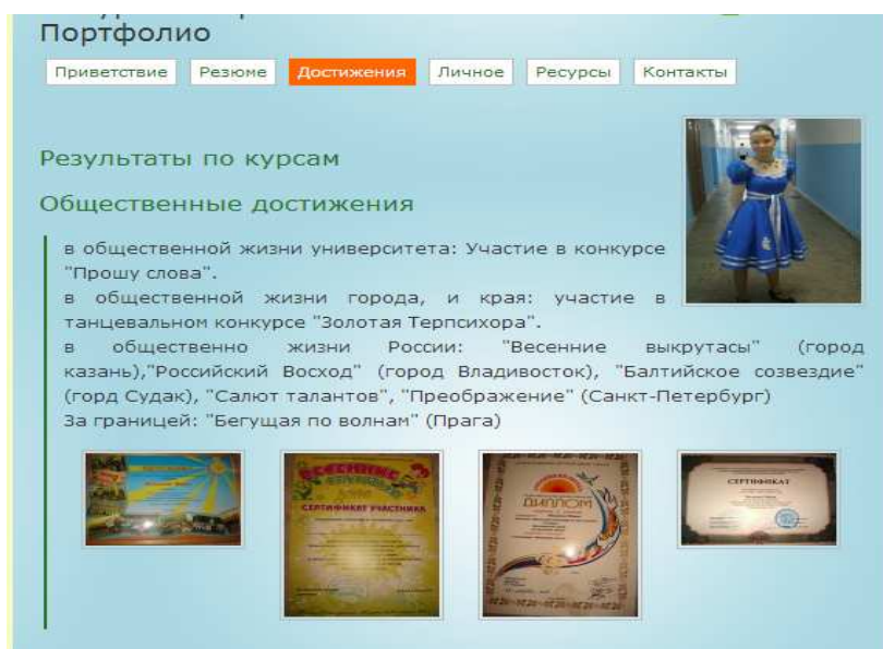
Рис. 1. Общественные достижения, представленные в е-портфолио студентки бакалавриата

Данный факт позволяет утверждать, что в ИППС СФУ используются методы, ориентированные на требования компетентностного подхода к подготовке педагогических кадров и направленные на выполнение студентами социальных и профессиональных задач на основе сформированных компетенций, полученных ими в процессе обучения в вузе.