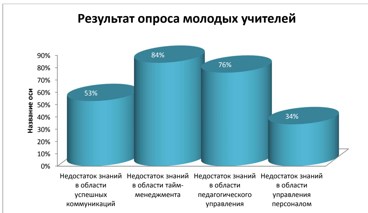
Рис. 2. Результаты опроса молодых учителей РТ по выявлению области недостаточных знаний педагогического менеджмента

Между тем, такой трансляции теории менеджмента в педагогический менеджмент, на наш взгляд, недостаточно. Хорошо развитые экономические позиции, теории развития и обучения управленцев в экономических отраслях не могут быть просто перенесены в область педагогики. Необходимо методологическое основание, описание принципов и методов развития менеджерских качеств будущих педагогов, определение механизма формирования управленческой компетентности как ядра профессиональных компетенций. Педагогические системы и процессы не только динамичны, но и активны, то есть ее субъекты самоуправяемы, перевод их в состояние управления, когда результативность процессов становится достижимой при любых исходных условиях – в этом и заключается основное направление развития управленческих качеств педагога.