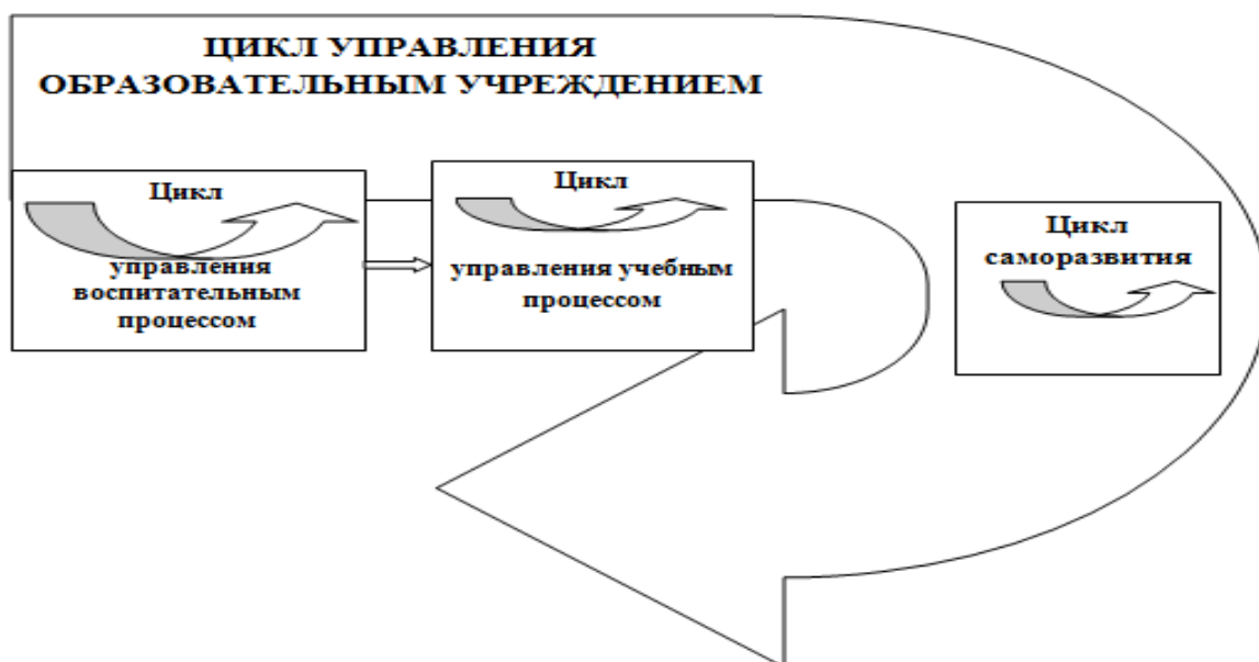
Рис. 3. Многомерные циклы управления будущего учителя

Здесь структура управленческой компетентности на основании когнитивной, деятельностной и персональной составляющей будущего учителя направлена на: