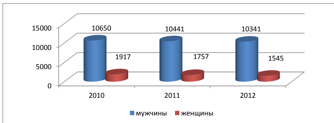
Рисунок 4. Состав людей по полу, совершивших преступления [5]

Угрожающей выглядит статистика совершаемых преступлений. Так, количество преступлений, совершенных мужчинами в 2011 году, в 6 раз превысило число преступлений, совершенных женщинами (рис. 4). Более 10 тысяч мужчин каждый год исключаются из состава трудовых ресурсов.