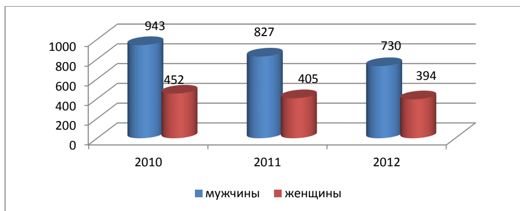
Рисунок 3. Заболеваемость туберкулезом среди мужчин и женщин [5]

Однако неверным будет рассматривать гендерную асимметрию исходя из ущербности только женских трудовых ресурсов. Мужская рабочая сила сегодня тоже нуждается в особом внимании. Сегодня женщины во многих областях наравне работают с мужчинами, но все-таки в силу биолого-физических различий на вредных и опасных работах заняты преимущественно мужчины. Это ведет к повышенному травматизму среди мужчин, нередко приводящий к смерти. Кроме этого, медицинской наукой доказано, что мужчины более подвержены стрессовым ситуациям: мужчины более подвержены алкоголизму, наркомании. Нередко нахождение мужчин в состоянии длительной депрессии приводит к самоубийству: добровольный уход из жизни воспринимается обществом как крайняя мера ухода от стрессовых ситуаций. Кроме того, мужчины менее беспокоятся о состоянии своего здоровья: обращение к врачам за медицинской помощью происходит уже в запущенные стадии болезни. Так, например, в республике мужчины заболевают туберкулезом в два раза чаще, чем женщины (рис. 3).