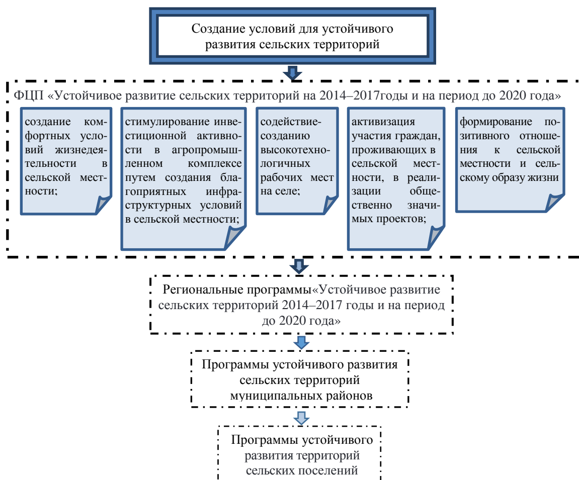
Рисунок 1. Система стратегического целеполагания развития сельских территорий

Результаты исследования и их обсуждение. Стратегические цели развития сельских территорий в российской практике управления имеют свои особенности. Во-первых, целеполагание представляет собой многоуровневый процесс, отражающий направления управленческого воздействия различных уровней власти. Во-вторых, наряду с их иерархичностью можно заметить, что стратегические цели формируются через выявление основных проблем в развитии сельских территорий, которые идентифицируются в процессе социально-экономического анализа и оценки имеющегося потенциала (рисунок 1). Такой подход чаще всего приводит к формализации нескольких групп стратегических целей. Каждый блок целей в последующем находит свое отражение в соответствующем разделе концепции и стратегии (программе) социально-экономического развития.