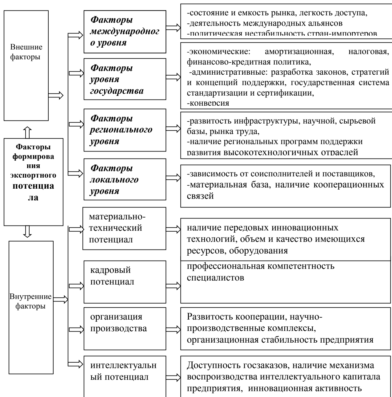
Рисунок 2. Факторы формирования экспортного потенциала предприятия машиностроения

Многообразие факторов, оказывающих влияние на экспортный потенциал предприятия, может быть классифицировано различными способами. Например, по способу воздействия факторы можно разделить на факторы прямого воздействия и факторы косвенного воздействия. Факторы, оказывающие немедленное влияние на операции предприятия, относятся к среде прямого воздействия. Факторы среды косвенного воздействия обычно не влияют немедленно на операции предприятия, но учитывать их необходимо в управленческих решениях. Среда косвенного воздействия сложнее среды прямого воздействия.