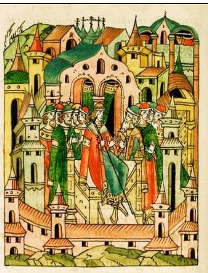
Рис. 2. Миниатюра Лицевого летописного свода. XVI век. Вокняжение Дмитрия Александровича во Владимире.