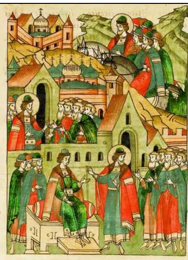
Рис. 3. Миниатюра Лицевого летописного свода. XVI век. Св. вел. кн. Александр Невский сажает Дмитрия наместником в Новгороде.

В представленных миниатюрах город является одним из ключевых элементов повествования. На рисунках изображены самые крупные и значимые города Руси – Москва, Владимир, Новгород, однако, все они обнаруживают типичные черты, свойственные городу в целом.