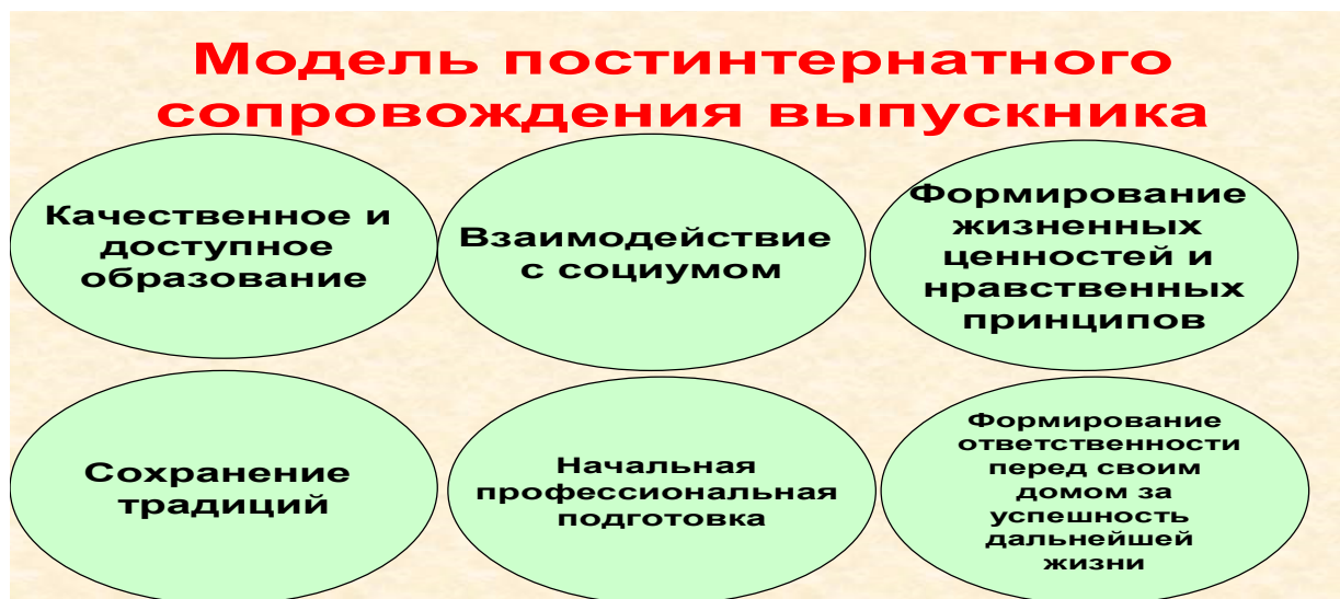
Рис. 2. Модель постинтернатного сопровождения выпускника

Нами была также разработана модель постинтернатного сопровождения выпускника (рис. 2).