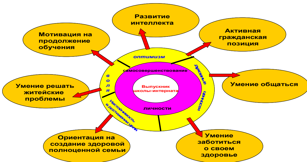
Рис. 1. Модель выпускника

Нами была также разработана модель постинтернатного сопровождения выпускника (рис. 2).