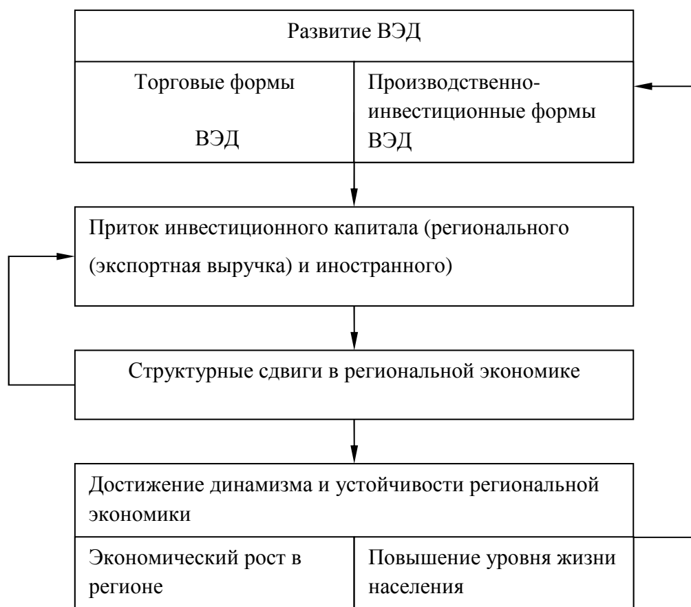
Рис. 1. Схема влияния ВЭД на социально-экономическое развитие и инвестиционные процессы в регионе.

Как известно, качественным критерием, определяющим степень влияния, является эффективность воздействующего фактора, т.е. в нашем случае – предприятий и организаций региона. Областью проявления эффекта выступает внутренняя среда фирм и региональной экономики в целом, а сферой проявления полученной эффективности – внешняя экономическая среда.