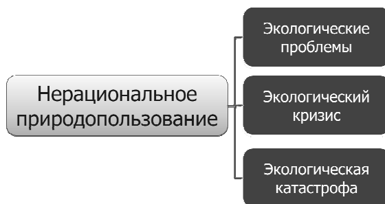
Рис. 2. Нерациональное природопользование