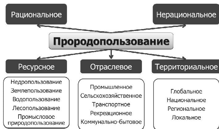
Рис. 1. Структурно-логическая модель понятия «природопользования»

Онтологический аспект включает систему знаний о видах и направлениях природопользования. Структурно-логическая модель понятия природопользования, а также соподчинённых понятий, раскрывающих сущность нерационального и рационального природопользования, представлены на рисунках 1, 2, 3.