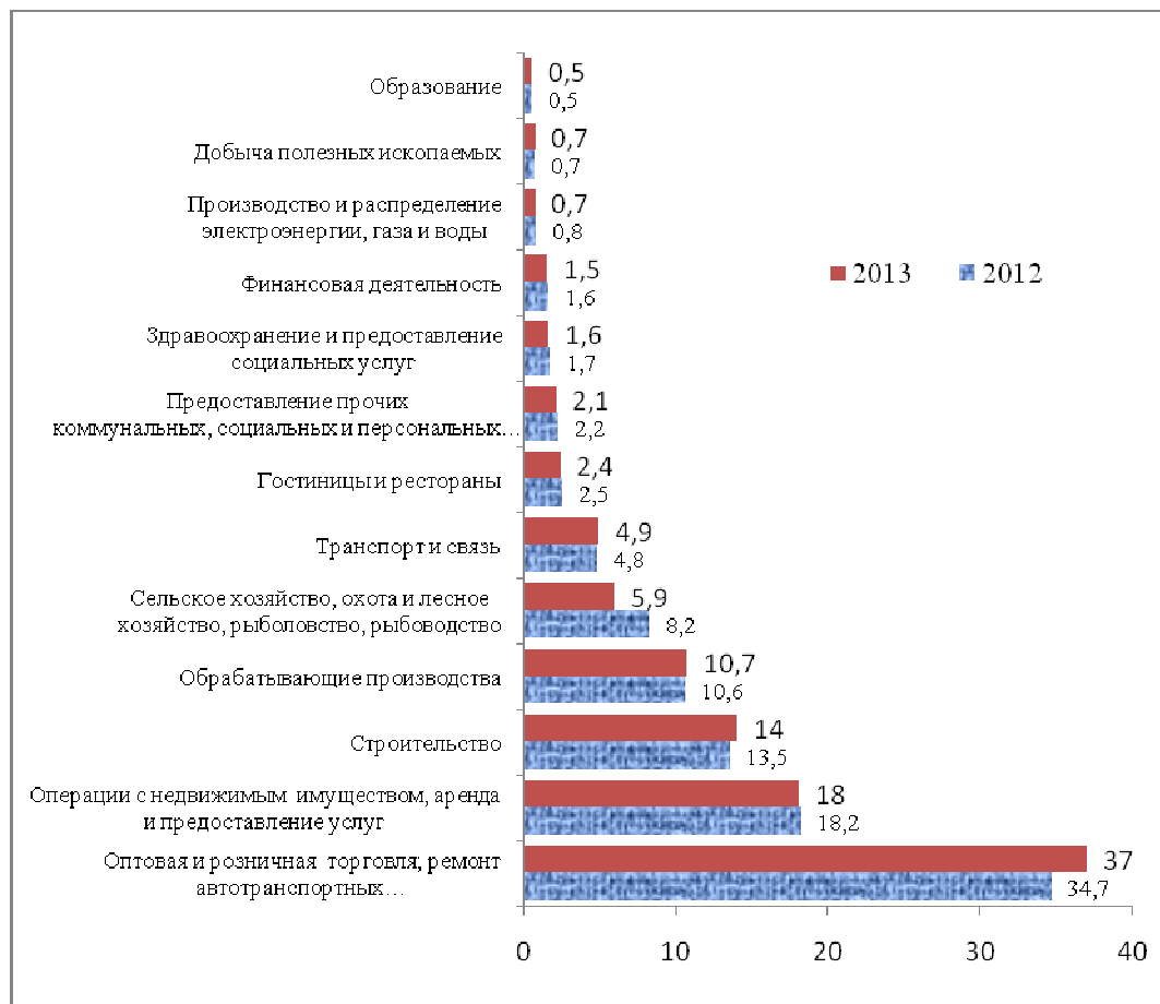
Рис. 1. Молодежное предпринимательство по видам экономической деятельности с 2012 по 2013 г.

По данным Территориального органа Федеральной службы государственной статистики по Республике Башкортостан, молодежное предпринимательство активно развивается и в 2013 году по видам экономической деятельности распределилось следующим образом [5]: