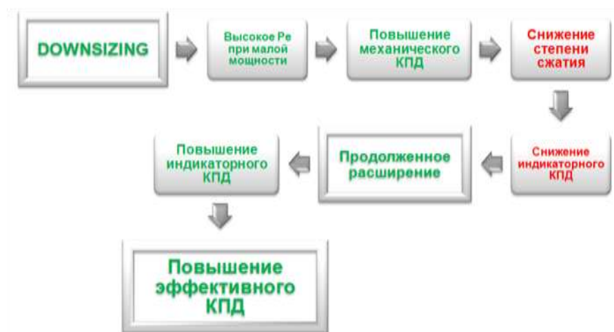
Рис. 3. Схема повышения топливной экономичности варианта «двигатель-эспандер».

Схема воздействия различных факторов на повышение топливной экономичности варианта «двигатель-эспандер» иллюстрируется рисунком 3.