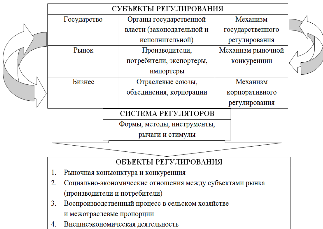
Рис. 2. Система регулирования сельского хозяйства.

Только ориентация государства на расширение объекта регулирования может обеспечить сельхозпроизводителям динамизм и устойчивость экономического развития. Каждый из перечисленных объектов имеет свою особенную роль в сельском хозяйстве, но только все они в совокупности определяют уровень и тенденции его развития в регионе.