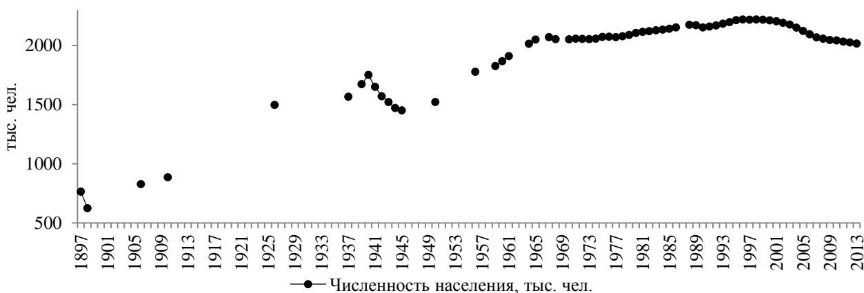
Рис. 2. Динамика численности населения Оренбургской области, тыс. чел.

Согласно представленной информации, можно сделать заключение, что основной «рывок» в увеличении численности населения области произошел в советский период. Показатель в этот период (1922–1990 гг.) удвоился, хотя и не достиг своего максимума в 2,2 млн человек (1998 г.). Рост населения в начале 1990-х годов объясняется миграционными процессами (миграция с территории экс-членов СССР) и приграничностью области [3]. Также стоит обратить внимание на значительный «провал» в годы Великой Отечественной войны, что объясняется отправкой мужского населения на фронт, конечно численность в данный период частично компенсировалась за счет внутривосточной миграции, однако сложившаяся ситуация прервала намеченную в 1930-е годы траекторию роста.