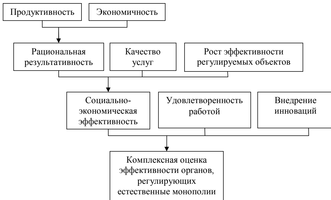
Рис. 3. Система индикаторов оценки эффективности деятельности органов государственной власти, регулирующих субъекты естественных монополий

Продуктивность – степень достижения органами, регулирующими деятельность субъектов естественных монополий, поставленных перед ними целей. Для оценки продуктивности сравнивают плановые показатели деятельности с фактическими.