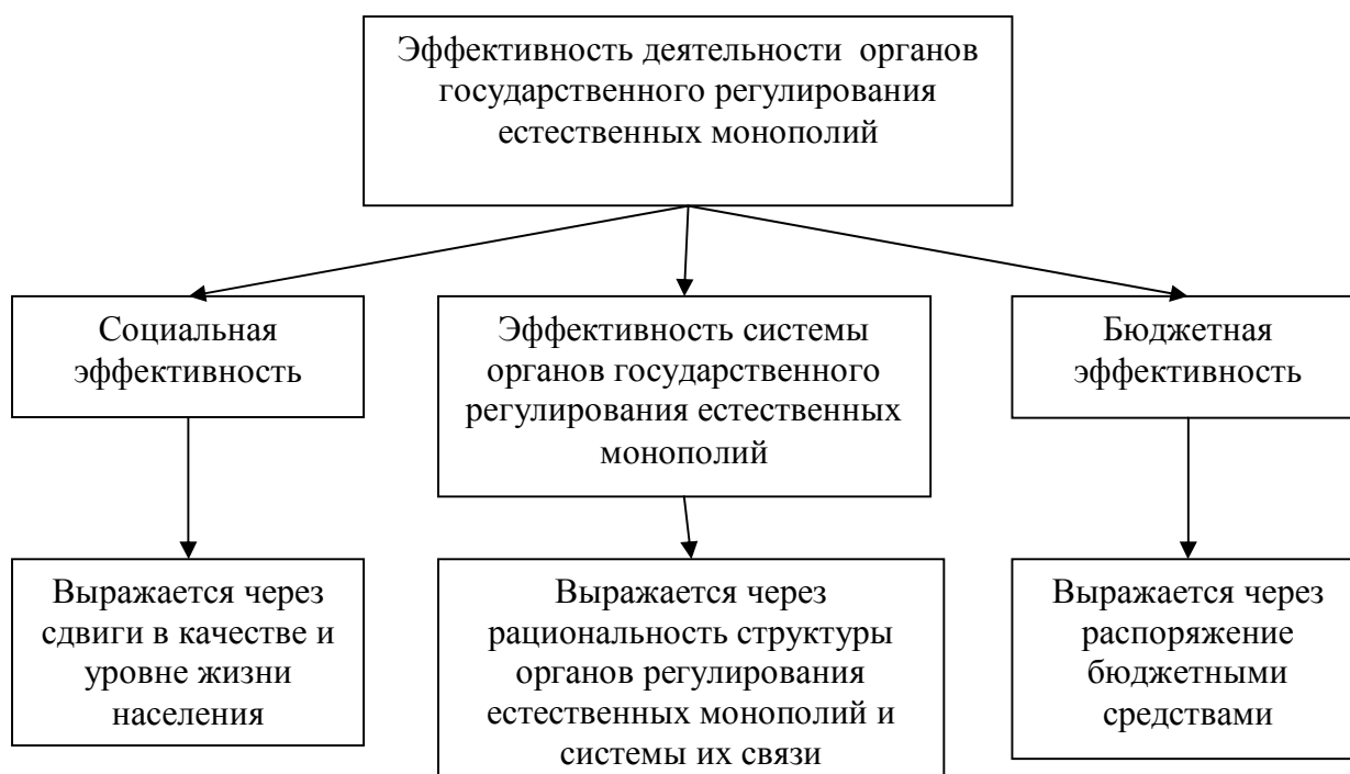
Рис 1. Структура эффективности деятельности государственных органов, регулирующих естественные монополии

Эта необходимость обусловлена тем, что часто при определении эффективности останавливаются на экономической эффективности, т.е. на соотношении затрат к результатам. При таком подходе не учитывается качество товаров и услуг, уровень удовлетворенности потребителей, что в случае с естественными монополиями особенно важно.