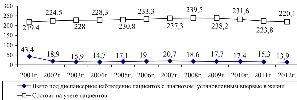
Рис 1. Динамика заболеваемости населения наркоманией в РФ 2000-2012гг. (человек, больных наркоманией на 100 тыс. населения)

Вместе с тем, по данным Министерства здравоохранения и социальной защиты РФ, пик вовлеченности населения в наркопотребление приходился на 2000 г. После этого уровень распространенности наркомании остается стабильно высоким (рисунок 1) [7].