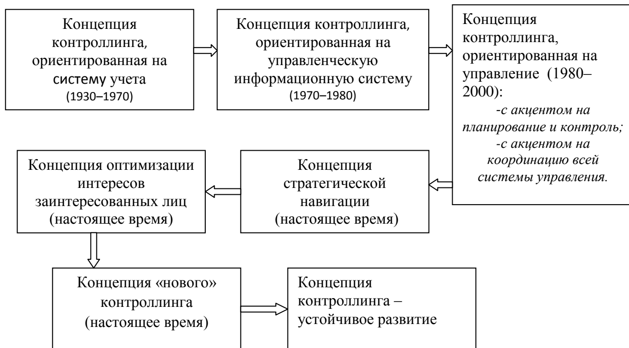
Рис. 2. Этапы развития концепций контроллинга [3,4]

Реализация принципов контроллинга и менеджмента качества тесно взаимосвязаны. Общие положения, принципы, взгляды на содержание эффективного процесса управления деятельностью организации определяет необходимость интеграции различных концепций, методов и подходов.