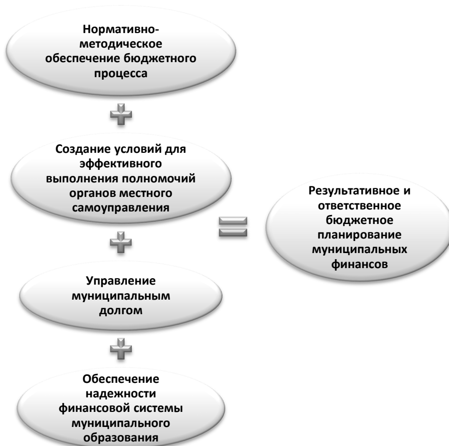
Рис. 1. Четыре составляющие бюджетного планирования муниципальных финансов.

Результативность и ответственность бюджетного планирования муниципальных финансов, по нашему мнению, должны включать 4 составляющие, представленные на рис. 1.