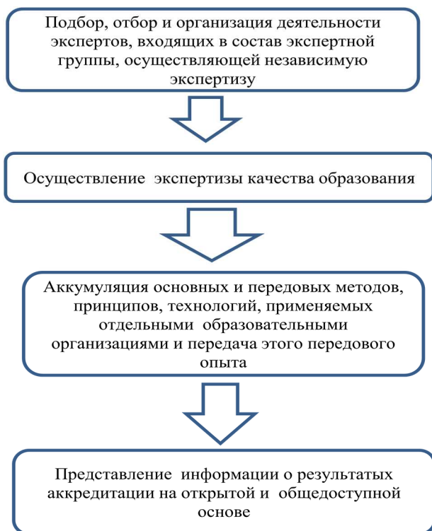
Рис.1. Укрупненные этапы проведения профессионально-общественной аккредитации

Естественно, что при построении всей структуры независимой оценки экспертные организации, прежде всего, обращаются к зарубежному опыту и зарубежной практике.