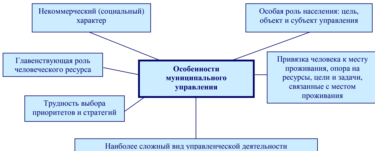
Рисунок 1 – Особенности муниципального управления

Процессно-статистический подход основан на принципах интеграции визуального и имитационного моделирования деловых процессов; использовании унифицированного языка моделирования UML для представления деловых процессов; автоматизированного синтеза имитационных моделей деловых процессов. Указанный подход позволяет учитывать случайный характер исполнения производственных и управленческих процессов [5].