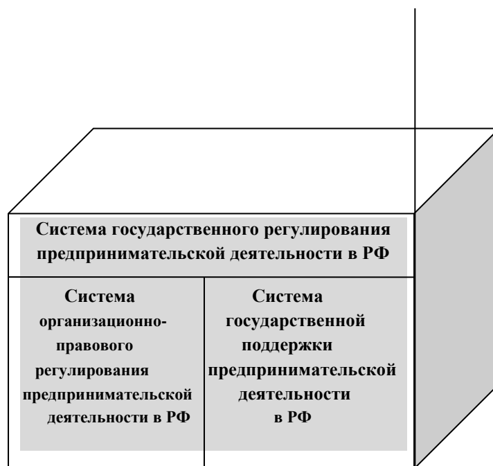
Рис. 1. Иерархическая соподчиненность подсистем государственного регулирования предпринимательской деятельности в Российской Федерации

Государственное регулирование предпринимательской деятельности реализуется посредством двух составляющих, регламентируемых в нормативных правовых актах: