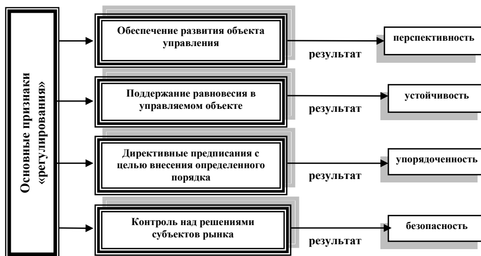
Рис.1. Основные признаки «регулирования», способствующие достижению результатов деятельности хозяйствующих субъектов (составлено автором)

Каждое из предложенных направлений обеспечивает достижение определенного результата, направленного на повышение эффективности деятельности субъекта рынка. Это перспективность, или способность в будущем к высокому развитию. Устойчивость – возможность сохранять равновесие при различных внутренних и внешних факторах воздействия. Упорядоченность – нормативно-инструктивная согласованность действий. Безопасность – отсутствие отрицательных воздействий. Перечисленное в совокупности можно отнести как государственному, так и к финансовому регулированию.