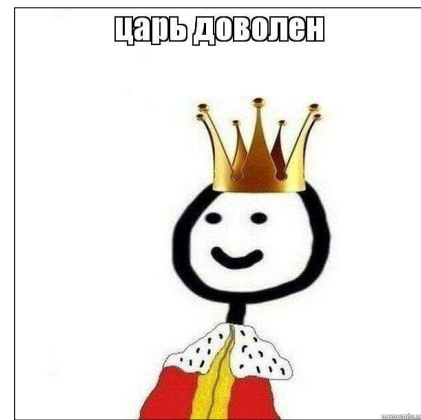
Рис.4. Нестандартные смайлы

Можно утверждать, что без такого дополнительного элемента как смайлы наше общение в виртуальной сети выглядело бы однообразным, более похожим на деловую переписку. Было бы трудно передать эмоции, приходилось бы расписывать многие вещи словами, что занимает слишком много времени, а некоторые вещи, к тому же, словами элементарно не передаются, как говорится, «не в сказке сказать, ни пером описать». Можно развести антимонию словосочетаний на половину страницы машинописного текста, как упражнялись Великие русские писатели и философы, а можно, как современный человек, обусловленный повальной компьютеризацией, вставить один или набор смайлов в текст и тем самым мгновенно объяснить что-либо собеседнику. В сетевом общении без смайлов были бы затруднения с юмором, так как иногда сообщения могут выглядеть обидно – но смайлик в конце сообщения все меняет и делает виртуальное общение более насыщенным, оригинальным и эмоциональным.