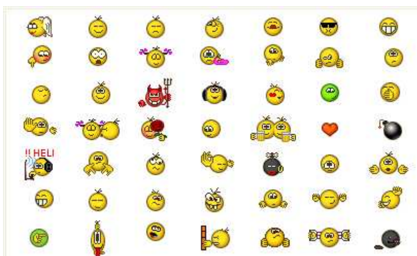
Рис.3. Основной набор смайлов клиента QIP

В настоящее время и текстовые смайлы начинают уходить в прошлое, а им на смену приходят графические, ещё более похожие на своих прародителей, графические картинки, изображающие лица, предметы, знаки и т.п. [ 4 ]. И если символные смайлы были понятны не многим, то графические позволили расширить круг людей, используемых данный инструмент виртуальной реальности для придания эмоциональности своим сообщениям. Это объясняется тем, что визуально сами смайлы стали более интереснее и, главное, понятнее для людей различного возрастного диапазона. Они представлены на рисунке 3.