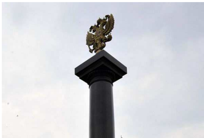
Рис. 2. Деталь мемориала «Город воинской славы» (2012 г., скульптор С.А. Щербаков)