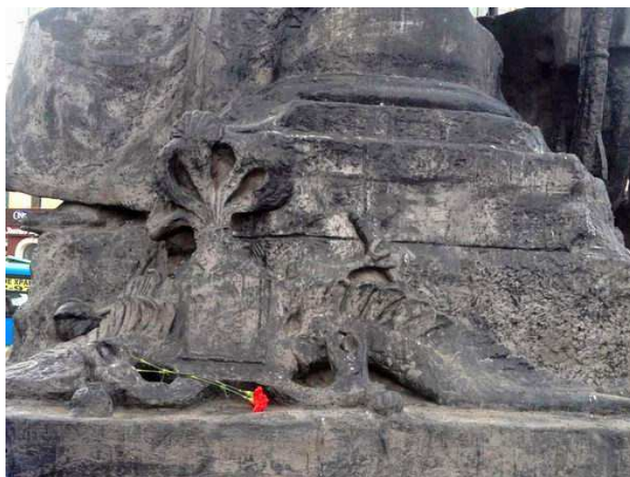
Рис. 1. Деталь Мемориального ансамбля «Борцам за Власть Советов на Дальнем Востоке 1917–1922 годов» (1961 г., скульптор А.И. Тенета)