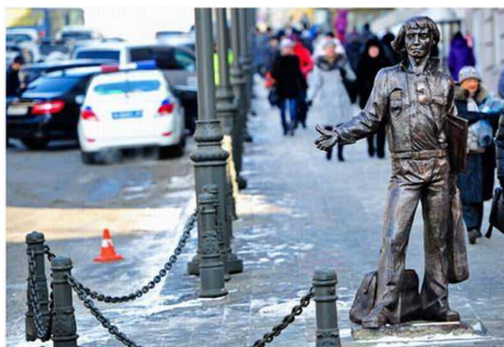
Рис. 3. Скульптура «Воспоминание о моряке заграничавания» (2013 г., скульптурная мастерская И. Дубровина)