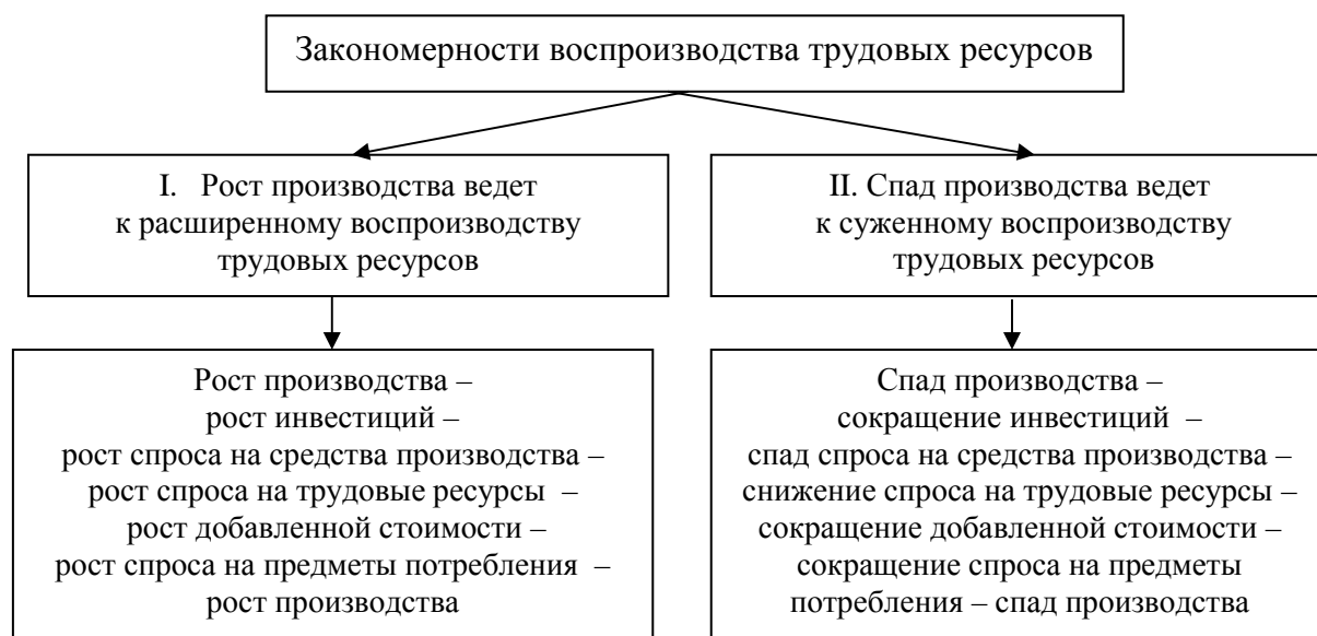
Рис. 2. Закономерности воспроизводства трудовых ресурсов*

Расширение производства способствует вовлечению большего количества трудовых ресурсов, что позволяет снизить уровень безработицы. Выявленные закономерности изменений общественного производства и воспроизводства трудовых ресурсов представлены на рисунке 2.