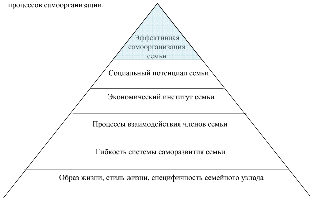
Рис. 2. Иерархия механизмов самоорганизации семьи

Гибкость системы саморазвития семьи обеспечивается процессами, связанными с постоянными изменениями, сменой этапов, циклов, состояний, структуры и реакций семьи на различные жизненные ситуации. Стабильность семьи – состояние относительное, т.к. ее развитие дискретно, переживает различные кризисы, вызывающие неустойчивость общего состояния «домочадцев». Однако именно неустойчивость выступает основным импульсом процессов самоорганизации.