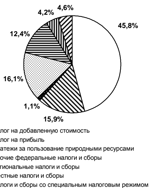
Рис. 1. Динамика структуры недоимки по видам налогов и сборов

Одним из самых важных направлений финансового планирования является использование возможностей потребительского сектора.