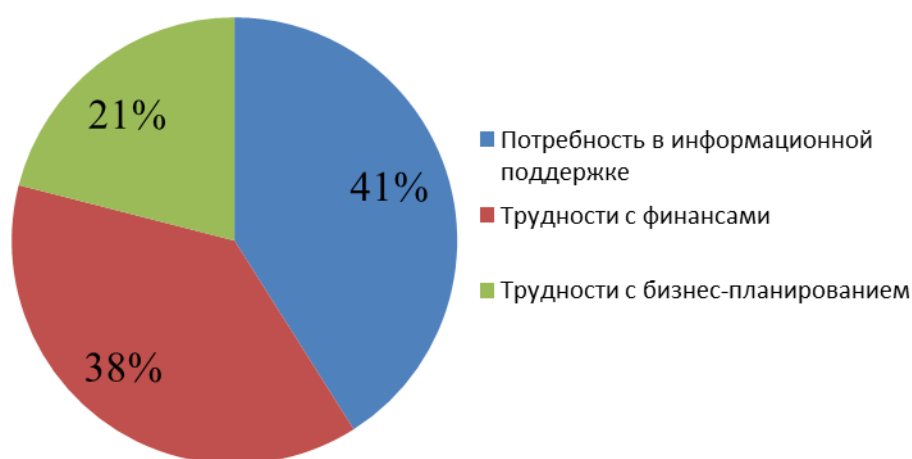
Рис. 2. Проблемы, с которыми сталкивается молодой предприниматель

Ответы на вопрос «Для решения каких проблем вам была бы необходима помощь со стороны?» были такими: потребность в информационной поддержке при открытии бизнеса – 41 %, трудности с финансами – 38 %, с бизнес-планированием – 21 % (рис. 2).