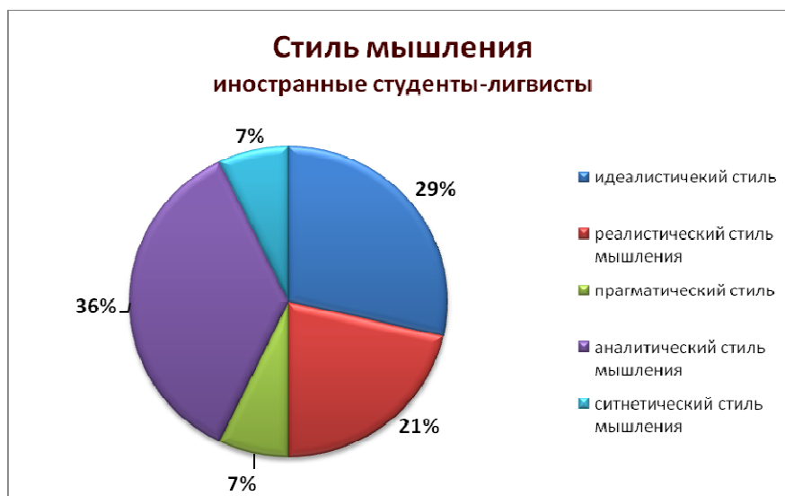
Рис 1. Диаграмма распределения по типу мышления иностранных студентов-лингвистов

Анализ результатов тестирования по методике оценки стиля мышления показал, что иностранным студентам-лингвистам свойственен аналитический стиль мышления (36 %) и чуть в меньшей степени идеалистический стиль (29 %) (рис. 1).