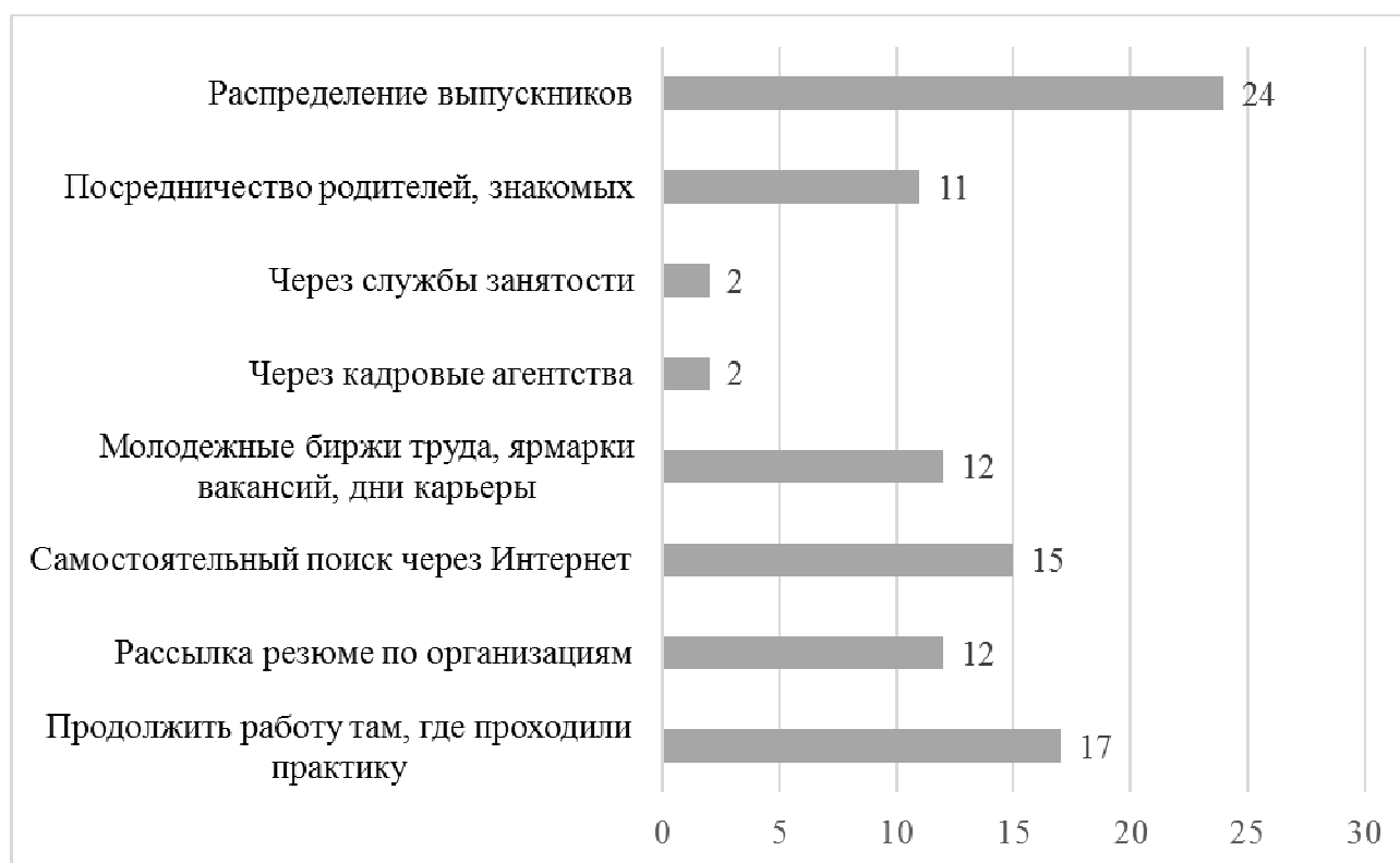
Рис. 2. Мнение студентов о наиболее результативных способах трудоустройства, %

Важно отметить, что до сих пор в студенческой среде распространено мнение о существовании системы распределения выпускников: трудоустроиться таким способом желает четверть студентов (24 %) профессиональных образовательных организаций. Данный факт свидетельствует о неполноте представлений студентов о современных способах трудоустройства и распространенности «советских мифов» и необходимости проведения комплексной профориентационной работы в образовательных организациях. Необходимость улучшения профориентационной деятельности в школах по ряду направлений высказывают и сами студенты профессиональных образовательных организаций: информирование об особенностях обучения в тех или иных образовательных организациях высшего и профессионального образования; психолого-педагогическое консультирование в целях содействия профессиональному самоопределению обучающихся, увеличения возможности самодиагностирования профессионально значимых качеств; адаптация методик и содержания преподавания к потребностям и склонностям обучающихся; информирование о мире профессий и о рынке труда и др.