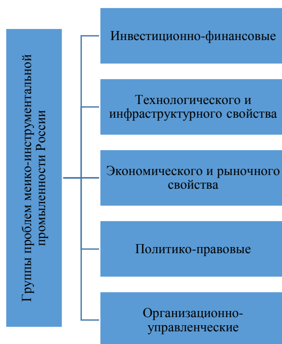
Рис. 3. Основные группы проблем российской медико-инструментальной промышленности

Анализ основных проблем российской медико-инструментальной промышленности позволяет систематизировать их по следующим группам (рис. 3):