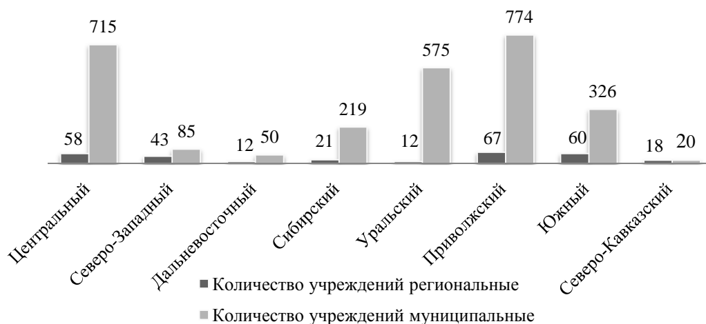
Рис. 2. Распределение учреждений органов по делам молодёжи по федеральным округам Российской Федерации [5]

Однако, несмотря на большую работу в области государственной поддержки молодежи, эффективность ее реализации остается на низком уровне. Как показывают многочисленные исследования, лишь 15% молодых людей положительно оценивают государственную молодежную политику, 32% опрошенных недовольны результатами реализации политики, 11% – затруднились оценить ее эффективность [7]. Кроме того молодежная политика ориентирована в основном на экстремумы в молодежной среде, что ведет к тому, что около 60% «среднестатистических» молодых людей оказываются вне интереса государственных органов по делам молодежи [9].