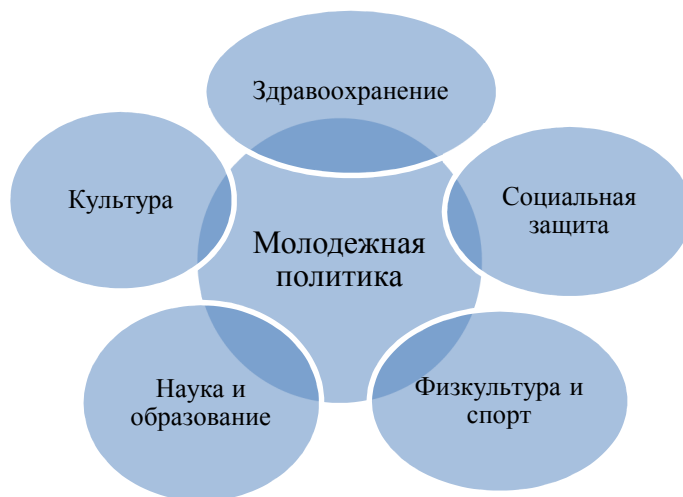
Рис. 1. Место молодежной политики в региональном развитии

безопасности; обязательное социальное обеспечение», «Образование», «Здравоохранение и предоставление социальных услуг», «Предоставление прочих коммунальных, социальных и персональных услуг» (рис. 1). Данное обстоятельство обуславливает сложность определения места и роли молодежной политики в системе регионального развития.