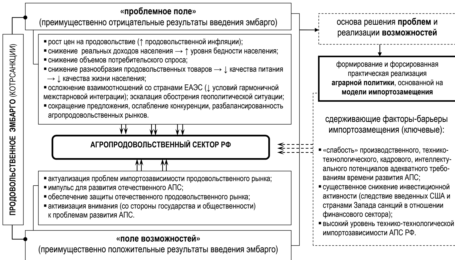
Рис.1. Систематизация проблемных аспектов и потенциальных возможностей развития агропродовольственного сектора экономики Российской Федерации (АПС РФ) от введения продовольственного эмбарго, составлено и обобщено автором